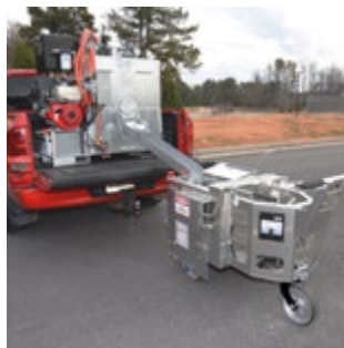
Carga a una ThermoMark 250 / 300

Indispensable para sacar el mayor provecho a su ThermoMark 250 / 300