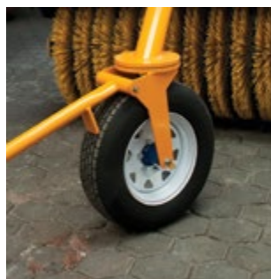
Freno de estacionamiento