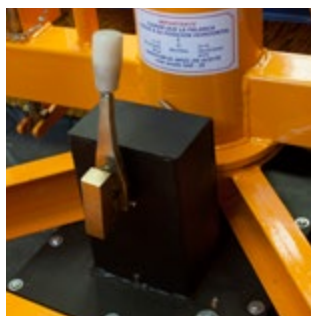
Transmisión de dos velocidades