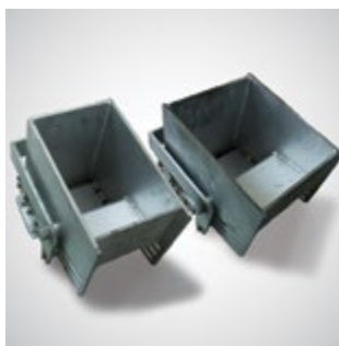
Dados intercambiables de distintos anchos