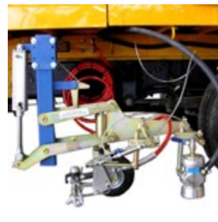
Piernas porta pistolas