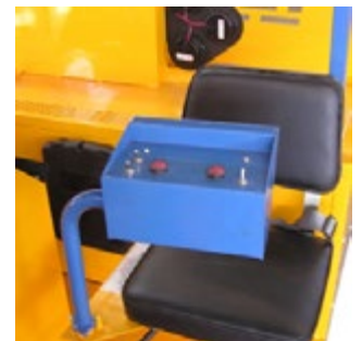
Asientos de ambos lados con controles