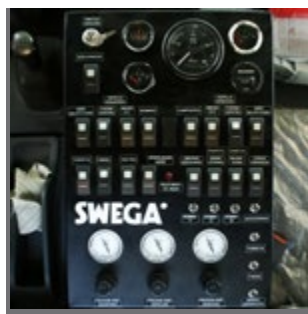
Tablero de controles