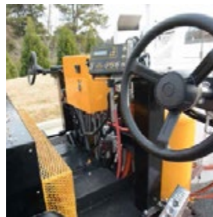
Volantes y controles